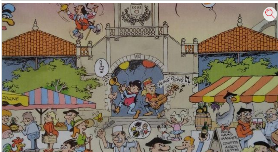
Mirande accueillera le rassemblement international Cittaslow du jeudi 21 au mardi 26 juin.

Mirande attend avec impatience mais aussi avec fierté, les 300 délégués venus d'une trentaine de pays pour le rassemblement international Cittaslow, qui se tiendra dans la bastide du jeudi 21 au mardi 26 juin. Ils découvriront ainsi le Gers, le département du bien vivre, où on laisse du temps... au temps. Tout cela, parce qu'un jour, à Brà, en Italie, en 1986, des élus et des administrés se sont mis en colère en refusant l'installation d'un fast-food. De ce mouvement est né le désormais célèbre «slow food», un label né en Italie, en 1999 cette fois, grâce à un certain Paolo Saturnini, à Greve in Chianti, qui, accompagné des maires de trois autres villes, a décidé de lancer le label Cittaslow. Cette philosophie s'est internationalisée et le label Cittaslow a été vite reconnu mondialement. Aujourd'hui, 191 villes de 29 pays sont labellisées, et, parmi ces villes élues, Mirande, la Gersoise. Cittaslow, littéralement «ville lente», est un label attribué aux villes où il fait bon vivre. Le point d'orgue de cette semaine (qui proposera aux visiteurs des rencontres, des réunions de travail, des visites touristiques, un repas de gala le samedi soir...), aura lieu vendredi 22 juin, avec le marché Cittaslow qui se tiendra sous la halle ; il est ouvert à tous. Les visiteurs pourront y faire leur marché, goûter les produits du terroir, composer leur déjeuner et, le soir, profiter, sur la place d'Astarac, de la Fête de la musique.