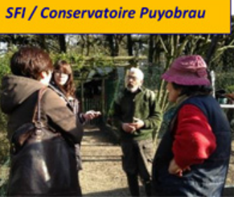
SFI / Conservatoire Puyobrau