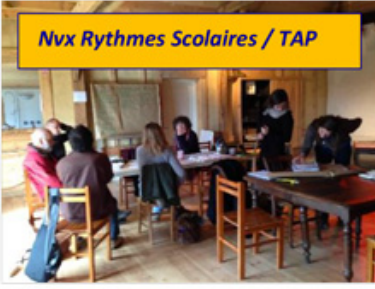
Nvx Rythmes Scolaires / TAP