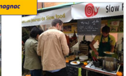
Défendre la Biodiversité / Fête Armagnac