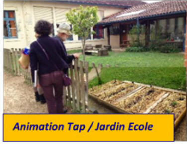
Animation Tap / Jardin Ecole