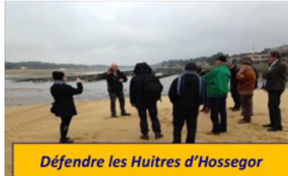
Défendre les Huitres d'Hossegor