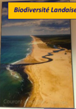
Biodiversité Landaise / Réserve Courant d'Huchet