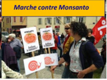
Marche contre Monsanto