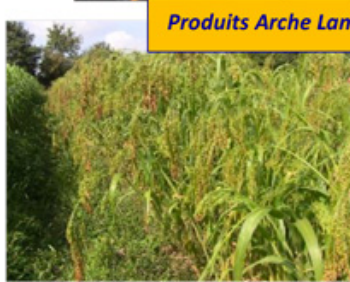
Produits Arche Landes