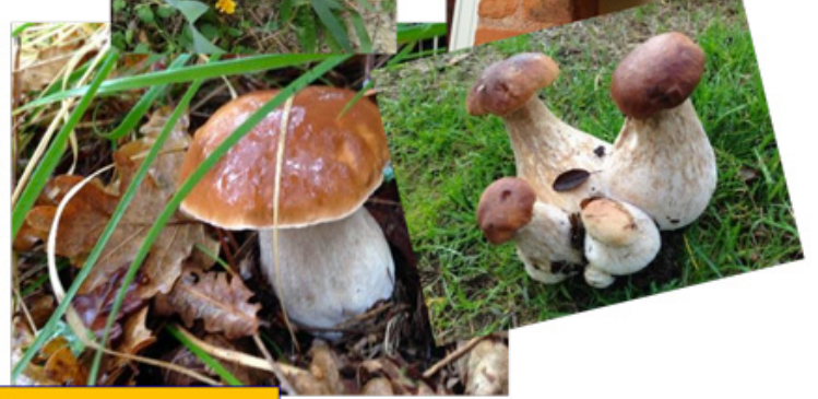
Slow Food Exposition Universelle / Milan