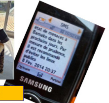
Projet Akadi Mali : Agroécologie / Tanima 2000 – Slow food – Mission 2014